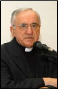
Piše: dr. Tomislav Ivančić