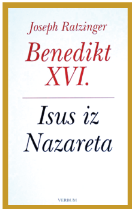
Naslovnica knjige koja je postala među traženijima u knjižarama vjerskog sadržaja

Dio knjige koji ostavlja vrlo upečatljiv Isusov govor, jest Govor na gori koji nam je svima poznat. Ali ono što je vrlo posredno jest onaj dio u kojem Isus govori o samome sebi. Isus za sebe svjedoči da je Sin čovječji, Sin Božji. Ono što je najsnažnije,