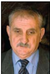
Piše: Mato Nosić

S vaki euharistijski čin, svako misno slavlje bilo koje razine duhovna je žetva. Ta metafora, koliko god korištena, nikad nije istrošena. Blagdan prave gozbe slijedi nakon žetve. Protega mu ide od zemlje do neba. Ako smo u raspoloživosti duše i uzljubljenosti srca zadoobili dar jedrih plodova, onda sjedinjeni s Kristom, blagujemo. To blažujstvo, radost koja istihana u nama od sreće «pjeva» dijelimo s bližnjim pa nam se čini da zemlja postaje djelić neba. Može se reći da pravo, istinsko crkveno slavlje donosi nebo na zemlju, anticipira budućnost, snaži za život i služi mu.