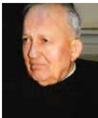
Piše: Zlatko Papac

Knjiga o Makabejcima čudesna je knjiga Staroga zavjeta. Trebalo bi je često čitati da bismo učili biti na visinama svoga ljudskog i kršćanskog dostojanstva. U njoj se opisuje kako su u teškim vremenima Božji ljudi ostajali na visinama časti, ponosa i dostojanstva. Današnji se odlomak ne da čitati bez suza i čuđenja. Opisuje majku-vjernicu koja prisustvuje mučeničkoj smrti svojih sinova što ih je odgojila po načelima vjere. Bijaše to doista majka-junakinja koja za svu ljudsku povijest ostaje spomenik vjerničke i majčinske ljubavi. Kada bi ovu Knjigu danas čitale majke i njihove kćeri, a s njima očevi i braća, prijatelji i susjedi, možda bi tada i život ljudi oko nas bio drukčiji. Učimo jedni druge - i jedni od drugih - pa ćemo tako biti graditelji novoga svijeta u nama i oko nas.