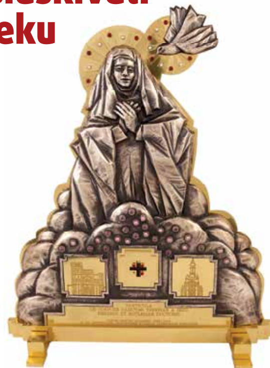
Relikvijar sv. Terezije Avilske, požeška Katedrala

Usljedila je točka pod kojom se govorilo o pastoralnim programima u Godini sv. Terezije Avilske te u Godini posvećenog života. Biskup je podsjetio kako je sv. Terezija jedna od najznačajnijih redovnica koja je svoju snažnu karizmu ugradila u obnovu Crkve i da ona izvrsno povezuje Godinu njoj posvećenu s Godinom redovnika. Istaknuo je da će se u korizmu, na temelju iskustva prethodnih godina, u svim župama petkom organizirati kateheze koje će se oblikovati prema obno-