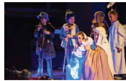
Božićne priredbe u katoličkim osnovnim školama • str. 24