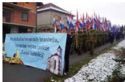
Hodočašće hrvatskih branitelja, vojske i policije u Voćin • str. 8