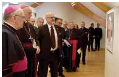
Izložba »Papa Franjo u Izraelu« u Požeći. • str. 2

N eka ovog Božića Isusova snaga ljubavi još snažnije zahvati svaku našu obitelj te nam po njihovu služenju Isus Krist, svjetlo neugasivo učini Domovinu svjetlijom. (Iz poruke biskupa Antuna za Božić 2019.)