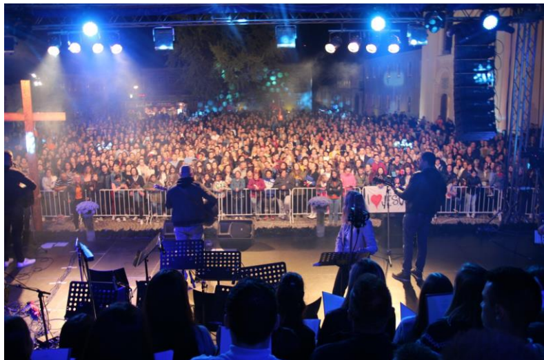
Glazbeno-duhovni program mladih "Otvorite vrata Kristu"

Za one koji žele biti aktivniji u svojoj župi, koji se vole baviti radom s djecom ili bilo kojim drugim aktivnostima kao volonteri, Povjerenstvo organizira edukaciju za župne animatore. Ovo je odlična prilika za sve one koji žele naučiti što je župa, kako dobro surađivati sa svećenicima u župi, kako raditi s djecom i