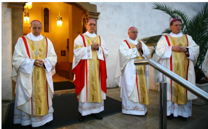
Otvorenje Drugog euharistijskog kongresa

sv. Lovre u Požegi otvoren Drugi biskupijski euharistijski kongres.