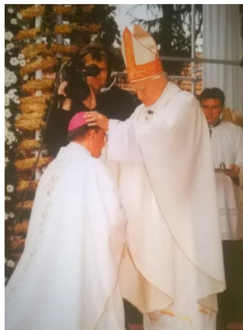
Ređenje biskupa Antuna

U subotu 27. rujna 1997. godine u Požegi se okupio vjerni narod iz cijele nove Biskupije na svečano euharistijsko slavlje uspostave Požeške biskupije i ređenja njezinoga prvog biskupa. Prvom požeškom biskupu sakrament svetog Reda biskupstva podijelio je kardinal Franjo Kuharić, a suzareditelji su bili Giulio Einaudi, tadašnji apostolski nuncij u Republici Hrvatskoj, i Josip Bozanić, novoimenovani zagrebački nadbiskup.