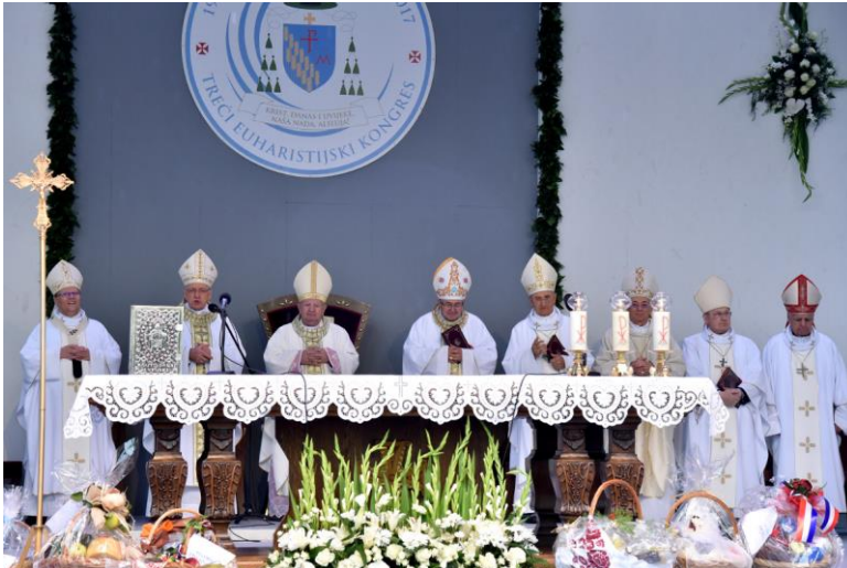
Treći euharistijski kongres

11.1.3. Treći euharistijski kongres svečano je otvoren 23. rujna 2017. godine povodom dvadesete obljetnice Požeške biskupije. Toga je dana službu Večernjih hvala u Katedrali, tzv. Vespere mladih , predvodio umirovljeni krakovski nadbiskup kardinal Stanislaw Dziwisz, dugogodišnji tajnik sv.