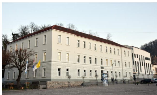
Katolička osnovna škola i Katolička gimnazija u Požegi

Kakve su to katoličke škole ? Što ih čini posebnima u odnosu na druge škole? Razlika je prvenstveno u tome što one nastoje biti vjerne evanđelju i djelovati u skladu s crkvenim naukom. U školi se rad započinje i završava zajedničkom molitvom, promovira se kršćanska duhovnost, a učenici imaju i svoga