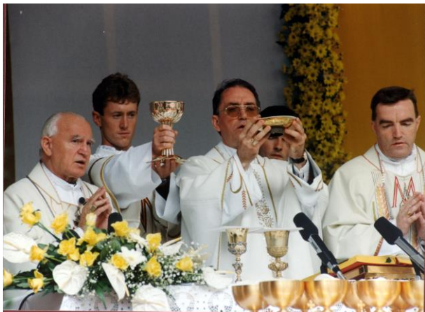
Detalj sa svete mise uspostave Požeške biskupije

Požeška biskupija je jedna od mlađih biskupija u Hrvatskoj. Osnovana je 5. srpnja 1997. godine, a za njezino sjedište odabran je grad Požega. Osim toga važnog datuma, važno nam je i slavlje uspostave Biskupije koje se dogodilo u Požegi 27. rujna 1997. godine. Otada svake godine u rujnu slavimo Biskupijski dan kada se sjećamo ovoga događaja. U usporedbi s dvije tisuće godina