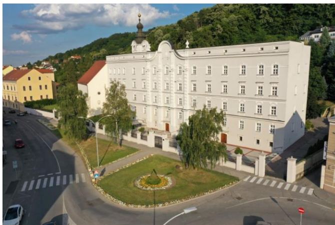
Biskupski ordinarijat u Požegi

8.1. Biskupski ordinarijat je tijelo koje u skladu s crkvenim propisima pomaže biskupu u upravljanju cijelom Biskupijom. Nekadašnja zgrada Kolegije (objasnit ćemo kasnije njezino značenje) nakon osnutka Biskupije preuređena je u Biskupski ordinarijat i Biskupski dom, a nalazi se u samom centru grada Požege.