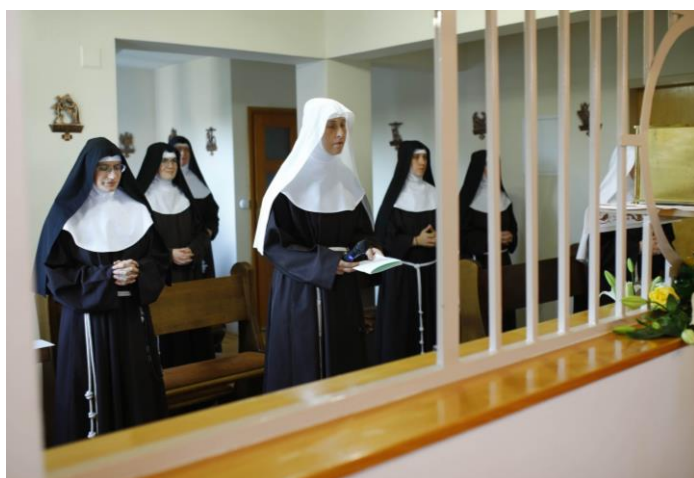
Redovnice klarise u svom samostanu u Požegi

U brizi za svećenike, redovnike i redovnice koji djeluju na području naše Biskupije, svake se godine za njih organiziraju različiti susreti i duhovne obnove. Kao što ljudi svake godine nekoliko dana imaju za godišnji odmor kada se odmaraju psihički i fizički, tako i naša duša traži obnovu – „punjenje baterija“, a to se događa upravo u trenucima duhovnih