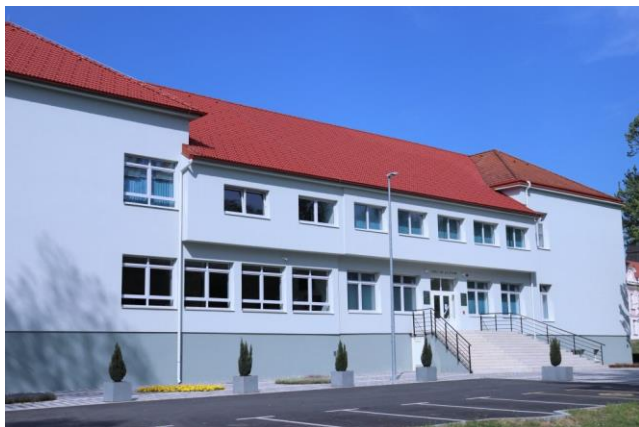
Katolička osnovna škola i Katolička klasična gimnazija u Virovitici

Od školske godine 2012./2013. osim klasičnog programa (što znači da učenici koji pohađaju školu uče klasične jezike kao što su latinski i grčki), Katolička klasična gimnazija u Požegi je proširila svoje obrazovno područje te jedan razredni odjel učenika otada upisuje u opće usmjerenje. Samim tim škola je dobila novo ime Katolička gimnazija .