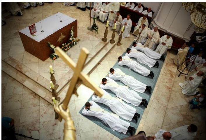
Svećeničko ređenje u požeškoj Katedrali (2015.)

obnova i vježbi. U susretu s Isusom kroz molitvu, svetu misu, tišinu, ispovijed i druge duhovne sadržaje svećenici i redovnici se „vraćaju“ Gospodinu koji im daje snagu da mogu i dalje biti vjerni i dobri navjestitelji evanđelja. Možda je ovdje dobro napomenuti da duhovne