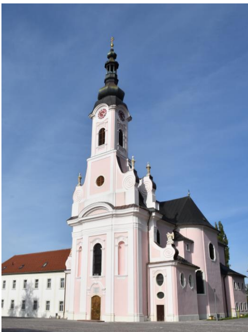
Katedrala sv. Terezije Avilske

Svaka biskupija ima svoju stolnu crkvu – katedralu. Utemeljenjem biskupije u Požegi dotadašnja župna crkva sv. Terezije Avilske uzdignuta je na stupanj i dostojanstvo katedrale. Katedrala je katolička crkva u kojoj se nalazi biskupska stolica koja se zove „katedra“. S te stolice (katedre) biskup predsjedava liturgijskim i drugim slavljinama i vrši službu posvećivanja, naučavanja i upravljanja Božjim narodom tj. vjernicima u svojoj biskupiji. Požeška katedrala građena je u baroknom stilu, a gradnja je započela 1756. godine. Nakon sedam godina gradnje posvetio ju je zagrebački biskup Franjo Thauszy 24. srpnja 1763. godine. Sve do 2007.