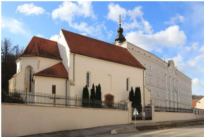
Crkva sv. Lovre u Požegi

Naš biskup Antun je u ime svećenika, redovnika, redovnica i svih vjernika predložio papi Ivanu Pavlu II. da upravo sv. Lovro bude zaštitnik naše Biskupije. Papa je prihvatio taj prijedlog i svojim papinskim dokumentom (ovaj put to nije tako svečani dokument kao apostolsko pismo, odnosno bula koju smo spomenuli, već se naziva apostolski breve ) potvrdio je sv. Lovru, đakona i mučenika za zaštitnika naše Biskupije. Zbog Lovrine ljubavi prema siromasima, izabrali smo ga i za zaštitnika Caritasa naše Biskupije.