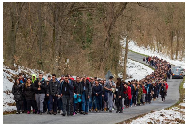
Biskupijski križni put mladih

Naša Biskupija se brine za različite skupine vjernika: za siromašne, stare i nemoćne, za djecu, bračne parove i obitelji, ali i za mlade. To je razlog zašto je osnovano Povjerenstvo za pastoral mladih koje u suradnji s vjeroučiteljima organizira i ostvaruje različite projekte za mlade vjernike. Među najpoznatijim događanjima je Biskupijski križni put mladih