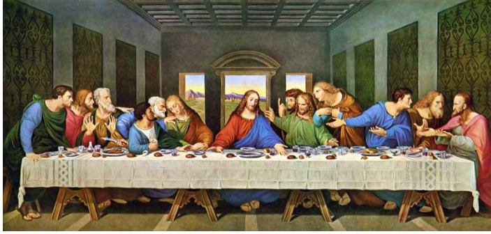
Leonardo da Vinci, Posljednja večera

Tu vjeru u Isusovu prisutnost želimo zajedno ispovijedati i očitovati u posebnom biskupijskom slavlju koje se događa svakih 10 godina – euharistijskom kongresu. Time želimo jedni pred drugima, ali i pred cijelim svijetom ispovijediti da vjerujemo u Isusa koji je i danas