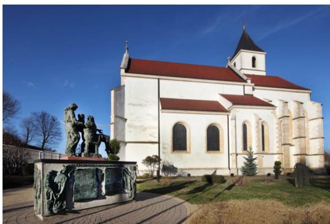
Crkva Pohoda BDM u Voćinu

Mjesto Voćin se nalazi podno sjeverne strane Papuka, u središtu Požeške biskupije između rijeke Save i Drave. Ono je sa svojim svetištem Majke Božje postalo i njezino duhovno središte. Zato ga je biskup Antun proglasio glavnim biskupijskim marijanskim svetištem.