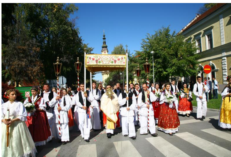
Drugi euharistijski kongres – Svečana procesija Požegom

Nakon otvorenja kongresa prema Katedrali je krenula svečana procesija s križem mladih praćena zvonima požeških crkava, ali i svih zvona župnih crkava Požeške biskupije koji su tim činom podsjetili na deset godina njezina postojanja. Kako je tada završila obnova Katedrale uslijedio je njezin blagoslov i posveta novog oltara. Na slavlju je sudjelovao i Jesus Garcia Burillo, biskup Avile, rodnog grada zaštitnice požeške Katedrale i grada Požege. On je u propovijedi podsjetio na bogat duhovni život sv. Terezije koja je veliku ljubav iskazivala prema Presvetom Euharistijskom Sakramentu. Često se pričješćivala, uključujući i dnevnu pričest dugi niz godina kada to nije bila redovitost u Crkvi, gajeći veliku čistoću savjesti, ispovijedajući se, makar imala samo lake grijehe. Na njezinoj duši pričest je ostavljala učinke koji su bili zadivljujući. Oni koji su je poznavali, kao i ona sama u svojim spisima, svjedoče o brojnim nadnaravnim milostima, uključujući i ekstaze koje je doživljavala kada je primala pričest. „Euharistija je za nju prvenstveno osobni susret s Kristom, privilegirani trenutak prijateljstva i intimnosti, najuzvišeniji dar koji duša ne može i ne smije upropastiti“, istaknuo je tada avilski biskup.