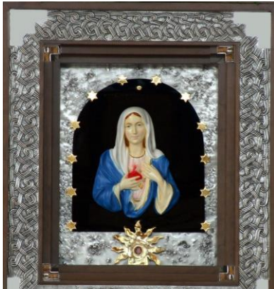
Reljef Bezgrješnoga Srca Marijina – Pleterničke Gospe od suza