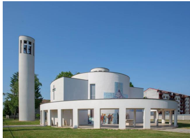
Stara i nova župna crkva u Staroj Gradiški