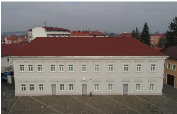
Dijecezanski muzej Požeške biskupije

Muzeji su kao kulturne ustanove veoma važni: u njima se pohranjuju kulturno-povijesni ili umjetnički predmeti koji se zbog znanstvenih i edukativnih razloga izlažu posjetiteljima.