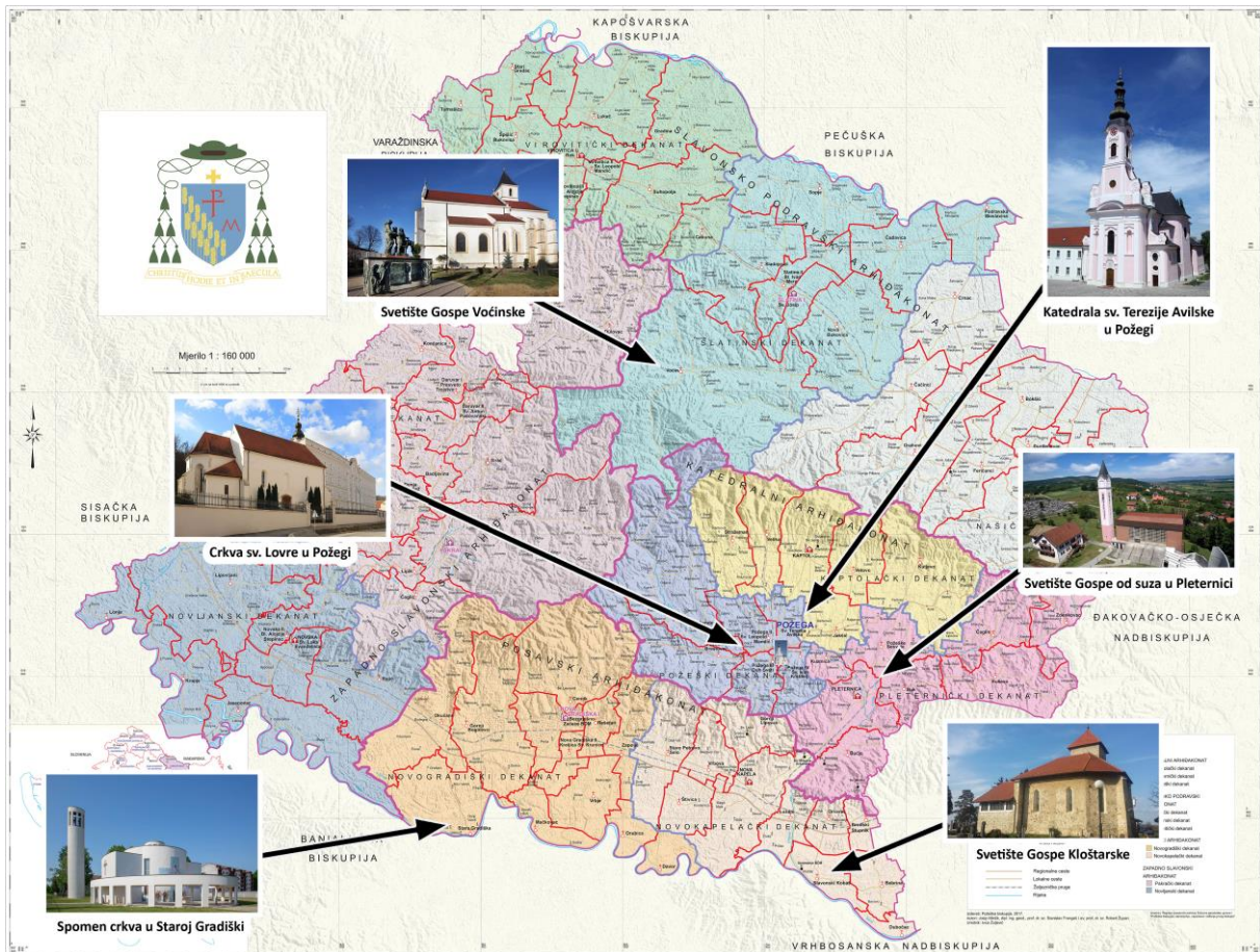
Karta Požeške biskupije s crkvama i svetištima od posebnog značenja