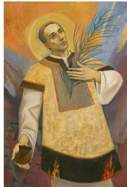
Sv. Lovro, zaštitnik Požeške biskupije

Za vrijeme progona cara Valerijana papa mu je prorekao da ga čeka teška borba za vjeru u Krista: „Mene Gospodin štedi jer sam slab starac, no tebi je odredio slavnu pobjedu“, zamolivši ga potom da sav crkveni novac podijeli siromasima. Lovro je tako i učinio, a kada je nakon tri dana došao na sud i rimski prefekt od njega zatražio da se odrekne svoje vjere i da mu preda crkveno blago, sveti Lovro mu je pokazao mnoštvo sirotinje i ubogih koje je poveo sa sobom kazavši kako su oni istinsko blago Crkve. Ljut što ga je sveti Lovro nadmudrio, rimski je prefekt naredio da ga muče, a nakon toga i ubiju i to tako da ga prže na roštilju.