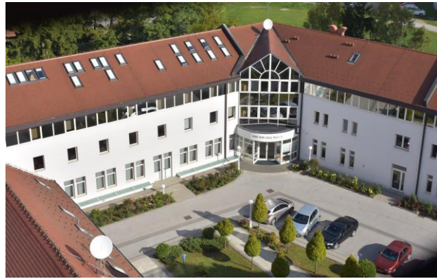
Kolegij Požeške biskupije

Danas je u toj zgradi Biskupski ordinarijat, a Kolegij djeluje u zgradi Doma pape Ivana Pavla II. i u njemu mogu besplatno boraviti nadareni učenici koji razmišljaju o svećeničkom zvanju ili prihvaćaju odgoj u duhu Katoličke Crkve koji služi kako bi se, zajedno sa školom koju pohađaju, osposobili da postanu